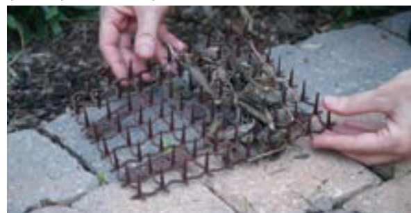
El Cat Scat Mat es un repelente seguro que puedes usar en tu jardín.